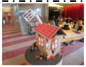
※写真は昨年のものです。